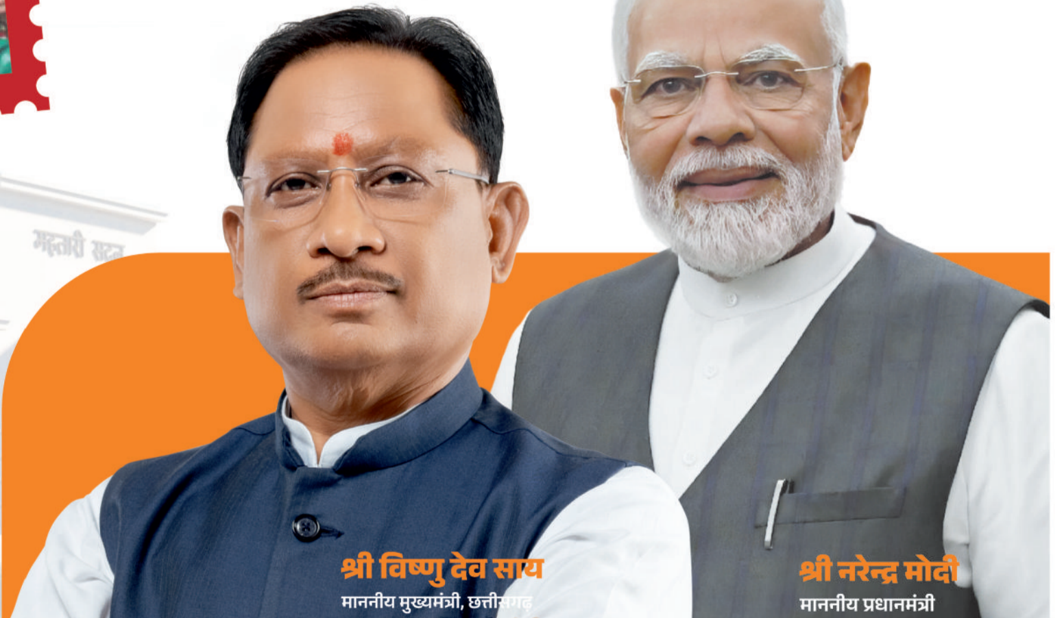
श्री विष्णु देव साय माननीय मुख्यमंत्री, छत्तीसगढ़

महिलाओं को रोजगार मूलक कार्यों के जरिए स्वावलंबी और आत्मनिर्भर बनाने के लिए पंचायत स्तर पर 179 महतारी सदनों का निर्माण