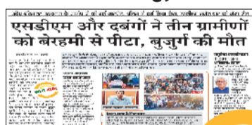
हरिभूमि न्यूज ►► कुसमी

एसडीएम समेत चार अन्य एजेंसियों के प्रतिनिधियों ने बुजुर्ग आदिवासी ग्रामीणों की मौत का मामला अब तूल पकड़ता जा रहा है। इस घटना के विरोध में मंगलवार को नगर बंद रहा। सर्व आदिवासी समाज व कांग्रेस ने धरना प्रदर्शन कर मामले में निष्पक्ष जांच व ►►शेष पेज 6 पर