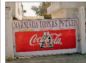
हरिभूमि न्यूज ►► बिलासपुर

सिरगिट्टी औद्योगिक क्षेत्र स्थित नर्मदा ड्रिंक्स प्राइवेट लिमिटेड में आयकर विभाग की टीम ने मंगलवार की सुबह छापा मारा। टीम सुबह 5 बजे फेक्ट्री पहुंची और अंदर मौजूद रिफॉर्मेड-दस्तावेजों की जांच शुरू कर दी। टीम में 10 अधिकारी थे जो तीन गाड़ियों में पहुंचे थे। फेक्ट्री पहुंचते ही आईटी की टीम ने कंपनी के अकाउंट, स्टॉक और वित्तीय लेनदेन से जुड़े कागजात का अपने कब्जे में ले लिया और खंगालना शुरू कर दिया। कार्रवाई के दौरान फेक्ट्री के अंदर-बाहर गतिविधियों पर ►►शेष पेज 6 पर