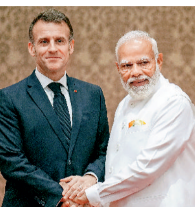
मैक्रों बोले- हम 'मेक इन इंडिया' के मारोसेमंद साथी इंडिया-फ्रांस इन्वैशेन फोरम में फ्रांस के राष्ट्रपति मैक्रों ने कहा कि डिजिटल सेक्टर में फ्रांस, मेक इन इंडिया का मारोसेमंद साथी है। उन्होंने कहा कि दोनों देश मिलकर नए जमाने के इंजन, मल्टी-रोल हेलिकॉप्टर, मोर्डन फाइटर जेट्स और पनडुब्बियां बनाने पर काम कर रहे हैं। मैक्रों ने कहा कि यह सिर्फ रक्षा सौदे तक सीमित बात नहीं है, बल्कि यह दो बड़े देशों की मजबूत साझेदारी है।

अब लीडरशिप वाला देश बन गया भारत इंडिया-फ्रांस इन्वैशेन फोरम में फ्रांस के राष्ट्रपति मैक्रों ने कहा कि भारत दुनिया में हो रहे नए आविष्कारों और नई तकनीकों में सिर्फ हिस्सा लेने वाला देश नहीं है, बल्कि आगे बढ़कर नेतृत्व करने वाला देश है। भारत की वैश्विक भूमिका की सराहना की। उन्होंने कहा कि अफगाबेट के सीईओ भारतीय हैं, माइक्रोसॉफ्ट के सीईओ भारतीय हैं, आईबीएम के सीईओ भारतीय हैं, एडोबी के सीईओ भारतीय हैं और पालो अल्टो नेटवर्क्स के सीईओ भी भारतीय हैं।